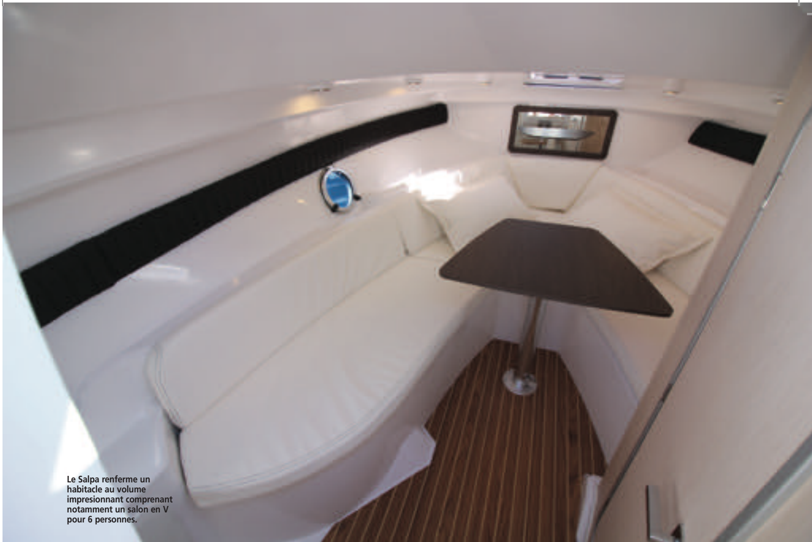
Le Salpa renferme un habitacle au volume impressionnant comprenant notamment un salon en V pour 6 personnes.