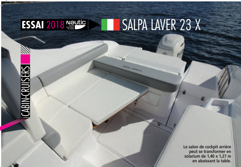
Le salon de cockpit arrière peut se transformer en solarium de 1,40 x 1,27 m en abaissant la table.