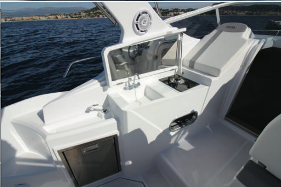
Cette mérienne de cockpit bascule pour découvrir une petite cuisine avec évier et feux à gaz optionnel, tout comme le réfrigérateur. L'utilité de disposer de deux éviers reste encore à prouver.