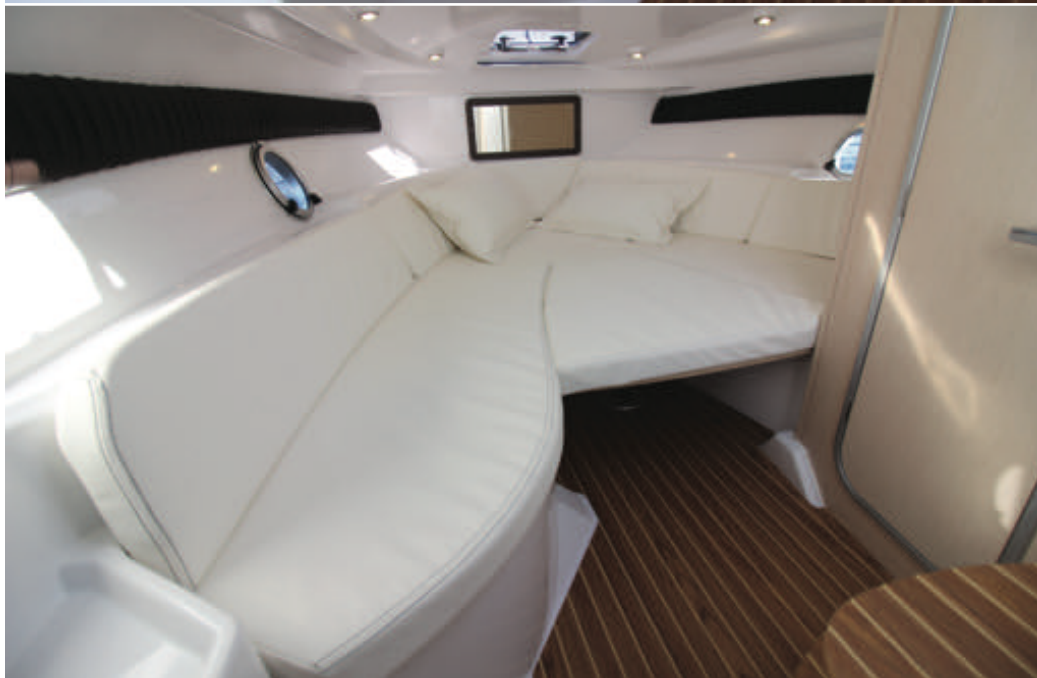
Cet espace de pointe clair et lumineux peut aussi se moduler en couchage double (1,80 x 1,50 m) à la nuit tombée. Dommage que la coque n'intègre pas de longs hublots translucides...

position une mid-cabin ouverte sur le reste de l'habitacle. L'intimité sera restreinte mais le couchage de 2,03 x 1,10 m dont la hauteur sous plafond atteint 0,56 m se révèle confortable. Des équipets situés au dessus de la tête de lit sont aussi à remarquer. Pour terminer l'inventaire, une salle d'eau logée à tribord offre tout le nécessaire pour la petite croisière avec son lavabo dont le robinet fait office de pommeau de douche puis ses wc électriques optionnels complètent la panoplie. Assez soignée, cette