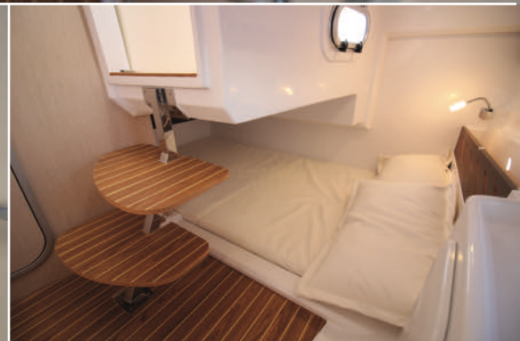
Ouverte sur le reste de l'habitacle, la mid-cabin comprend un lit double de 2,03 x 1,10 m.

Motorisé avec la puissance maximale de 250 ch Suzuki, le Salpa Laver 23 X présente de belles performances et des accélérations plutôt toniques. Effectivement les 35,5 nds de vitesse de pointe sont à constater tandis que le 0 à 30 nœuds est accroché en 10 secondes. Nous ne saurons donc trop vous conseiller d'opter pour cette puissance, surtout si vous pensez embar-