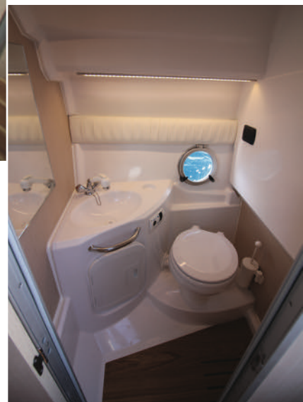
Plutôt réussie la salle d'eau qui affiche une hauteur sous barrots de 1,60 m sera idéale pour la croisière.