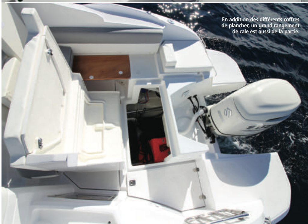
En addition des différents coffres de plancher, un grand rangement de cale est aussi de la partie.