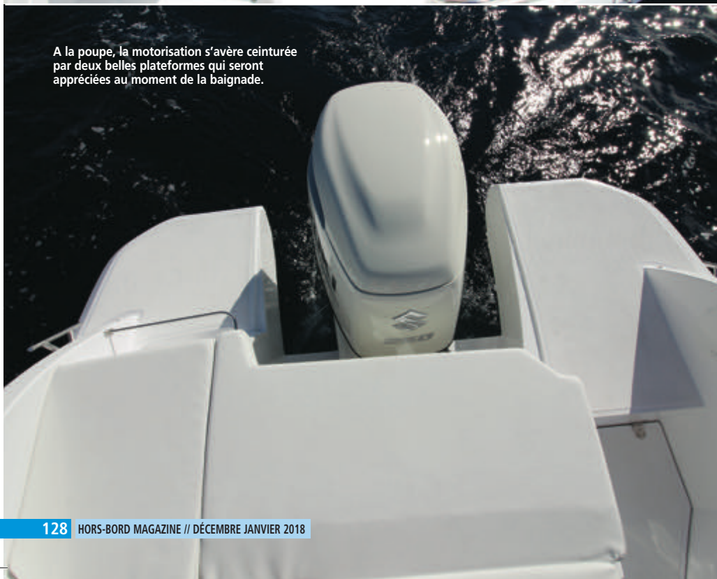
A la poupe, la motorisation s'avère ceinturée par deux belles plateformes qui seront appréciées au moment de la baignade.