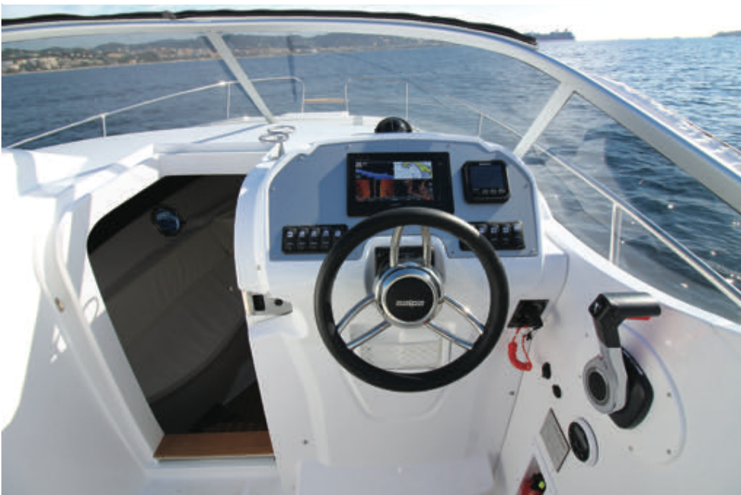
Assez complet le poste de barre offre un grand tableau de bord accompagné d'un large cale-pieds et d'un filet vide poche situé sous le volant. Pour sa part, la manette de gaz tombe bien sous la main.