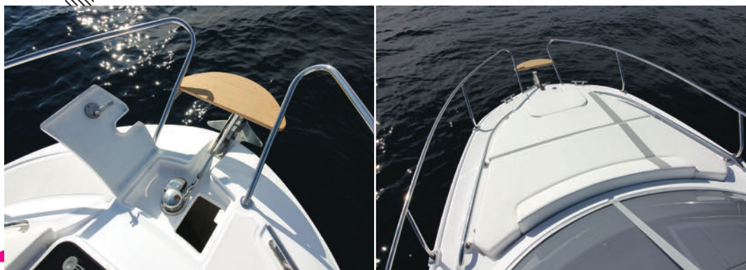
A la pointe l'accès à la chaîne n'est pas des plus évidents avec la présence du guindeau. Pour sa part le pont est occupé par un bain de soleil double optionnel affichant des dimensions de 1,40 x 1,40 m.

A vec plus de 30 ans d'existence dans la construction navale, le savoir faire du chantier napolitain n'est plus à démontrer. Les bateaux Salpa sont issus de la collaboration entre le bureau technique de la marque avec le département ingénierie composite de l'université de Naples Federico II. Sachez aussi qu'une nouvelle usine de production dont les investissements se sont élevés à plus de 13 millions d'euros a d'ailleurs vu le jour en 2008. Bref, vous aurez facilement compris que le chantier Salpa dispose d'un certain savoir et que sa renommée n'est plus à prouver de l'autre coté des Alpes. Son catalogue comprend actuellement près d'une dizaine de modèles dont les longueurs s'échelonnent de 20 à 52 pieds à travers des opens, cabin-cruisers, vedettes et même un semi-rigide de 23 pieds. Cotés motorisations, les bateaux embarquent des transmissions in-bord ou hors-bord et certains modèles sont aussi proposés au choix avec l'un des deux types de propulsion. C'est d'ailleurs le cas du Laver 23 de notre essai, un cabin-cruiser de 7,60 m proposé