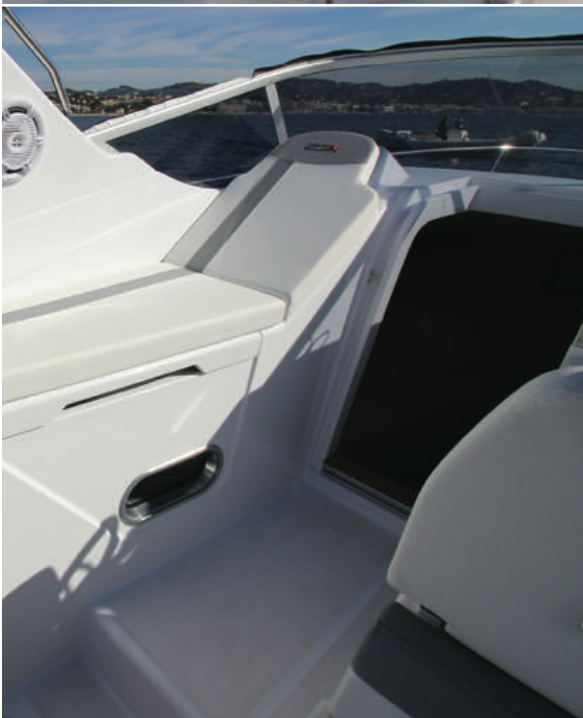
Sur l'avant bâbord du cockpit une mérienne assez étroite (0,45 m) permet de s'allonger face au sillage.